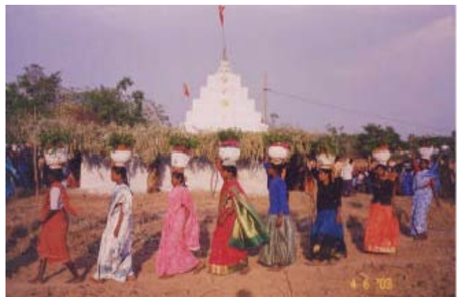
村の寺院の改築祝いで、女性達のご飯の入った壺を頭に寺院の周囲を回っているところ