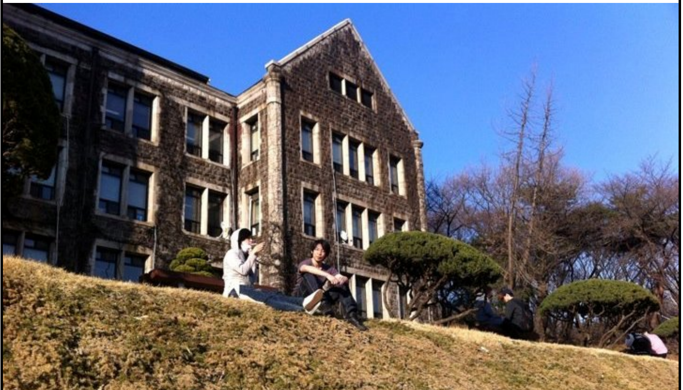
写真 1 : 2011 年春、延世大学社会科学部の研究室のある建物の前にて。思い出の場所。

韓国は日本とほぼ同時期に 1990 年代後半から自殺者が急増して以後高止まりの状況である。現在は日本以上に自殺率は高い。それだけ社会問題が深刻であるとも言えるだろうが、一方韓国で感じさせられた