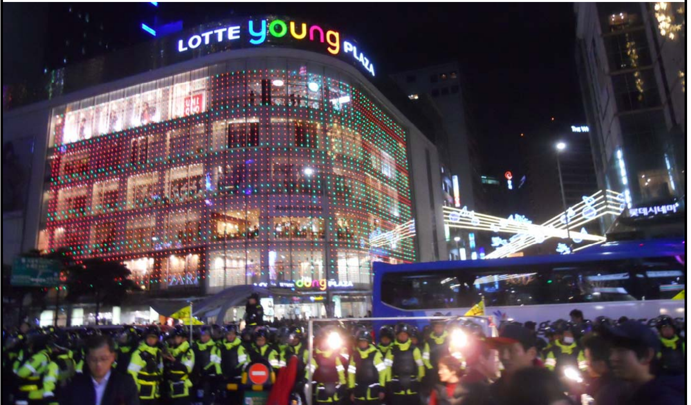
写真2：2011年11月22日、韓米FTAの強行採決後、ソウルの繁華街明洞（ミョンドン）に集まった市民を包囲する警察隊。この後、警察はデモを解散させるために放水銃を発射した。

ものは「活気」である。一つは日常生活において喜怒哀楽を正直に表現する風土であり、これはマイナスの感情の噴出だけを見るならば肯定的なものではないのかもしれないが、そのような日常の風土が生活を豊かにさせているのではないかと漠然と考えさせられたりしていた。そして、そのような風土は日常生活だけでなく社会・政治問題においても見られる。若い人を含めた人々の政治・社会への関心、意見表出というのは、日本と比較してとりわけ感じさせられる韓国社会の特徴の一つであった。おそらく、これもそれだけ社会問題が深刻であると捉えられる一方、そのような関心や運動があるならば今後の社会変革が可能であるのではという希望を感じさせられるものだと思っていた。