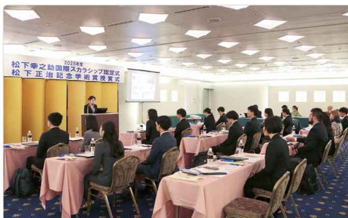
松下正治記念学術賞として出版