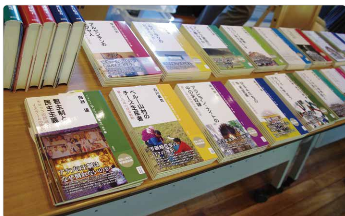
ブックレットとして出版