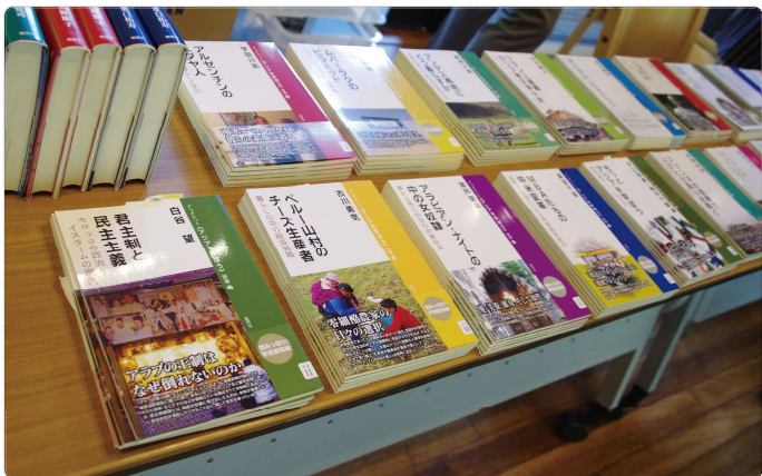
ブックレットとして出版