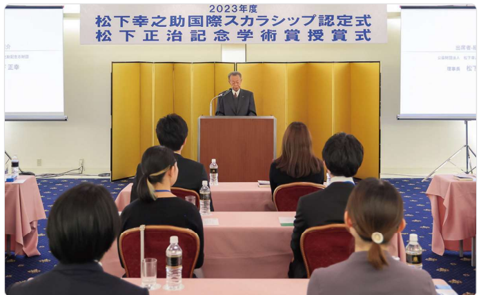
松下正治記念学術賞として出版