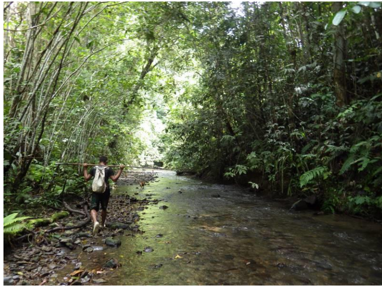
写真 1. 槍を手にイノシシを求めて森を歩く狩猟者