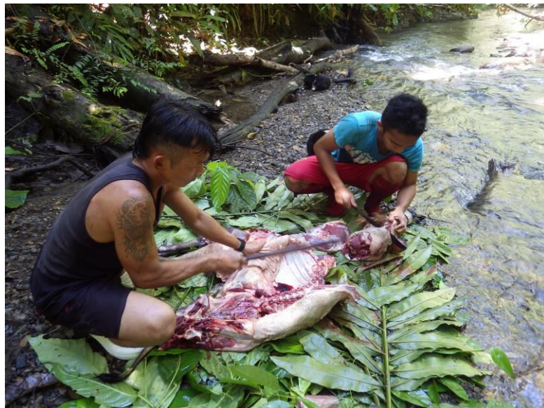
写真 2. 獲れたイノシシ肉を狩猟参加者で均等に分配する